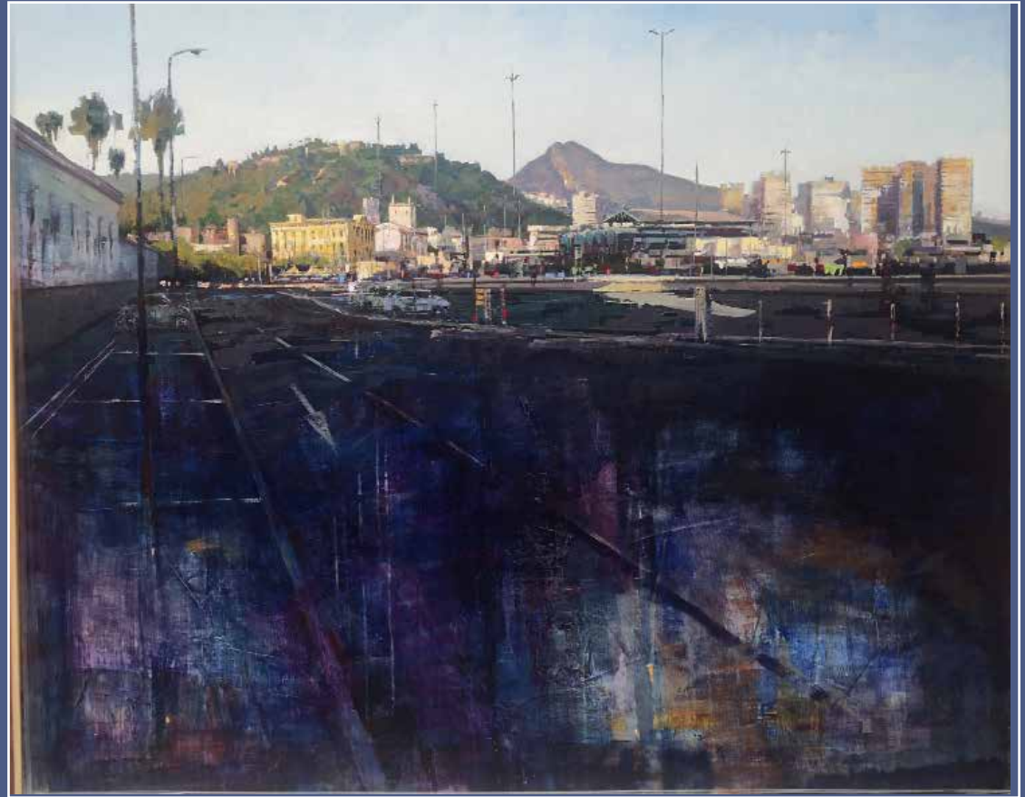
PRIMER PREMIO: ANTONIO CANTERO TAPIA "Atardecer en el puerto de Málaga" Óleo sobre madera 120 x 100 cm 2021