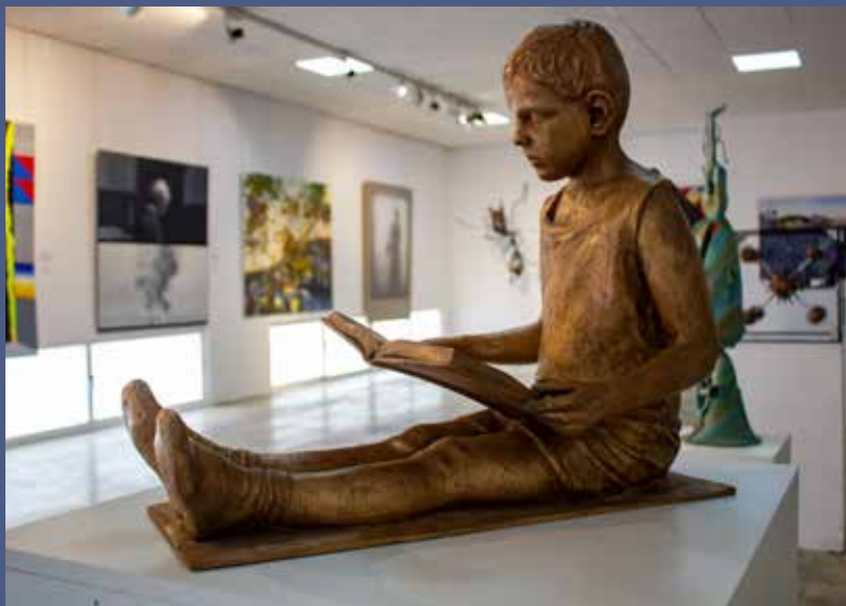
PEDRO QUESADA SIERRA “Niña leyendo en soledad”

ESCULTURA: MENCIÓN HONORÍFICA DEL PÚBLICO. OTORGADA POR VOTACIÓN EN URNA DEL PÚBLICO ASISTENTE Por empate en votos, se otorgan dos menciones del honor del público: