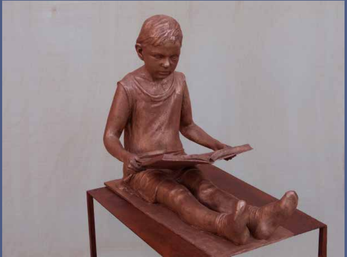
MENCIÓN HONORÍFICA: PEDRO QUESADA SIERRA "Niña leyendo en soledad" Bronce. Modelado en barro previo y moldes de silicona 65 x 55 x 40 cm , 45 kg 2020