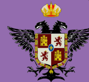
Excmo. Ayuntamiento de Alhaurín El Grande