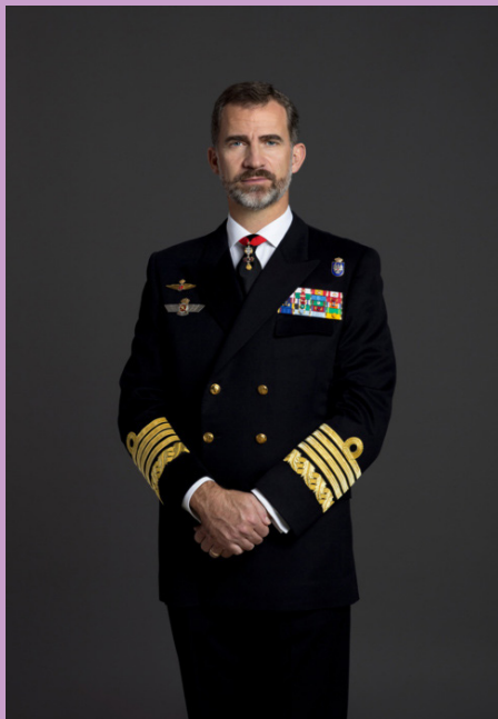
S.M. El Rey Don Felipe VI, Presidente de Honor del VIII Congreso Nacional del Dulce Nombre de Jesús.

20:00 h. En la Ermita de San Sebastián. Entrega de recuerdos a las Hermandades asistentes. Elección de la sede del IX Congreso Nacional del Dulce Nombre